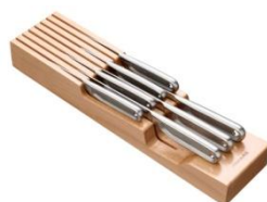
Drewniany blok na noże – ok. 325